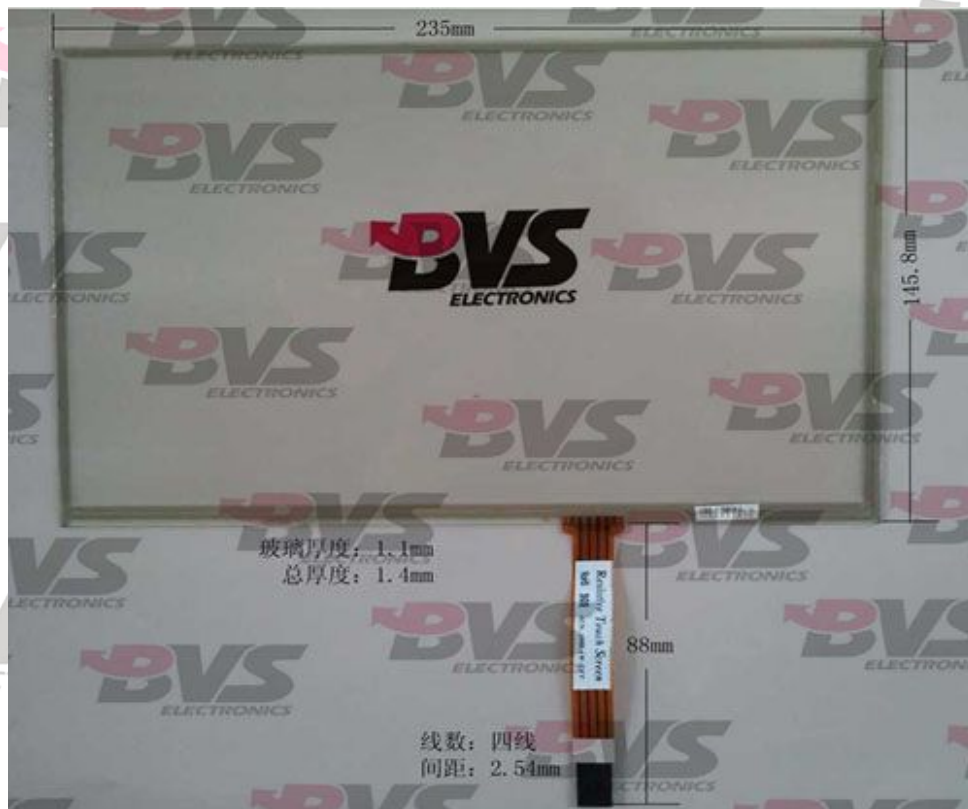
1.10.2 英寸四线电阻触摸屏实物图 10.2 inch 4-Wires Resistive Touch Screen